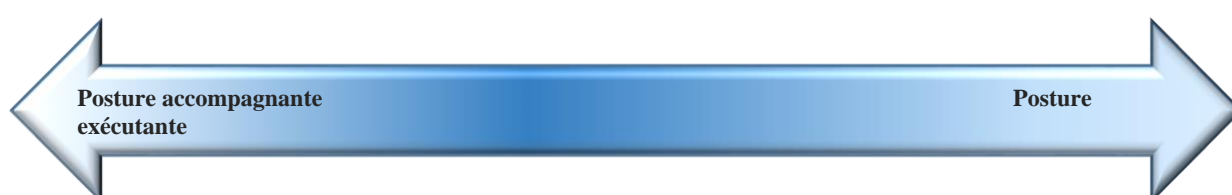
Figure 1 : Continuum illustrant la posture des enseignants dans l'E@D

Enfin, à la lumière des résultats, nous pouvons constater que les postures des enseignants dans l'E@D se situent sur un continuum (Fig.1) allant de la posture accompagnante basée sur la flexibilité et l'empathie jusqu'à la posture exécutante, axée sur la tâche et inspirée de l'enseignant « exécutant » décrit par Meirieu (2018). Au centre se trouveraient les enseignants aux postures nuancées. Ces derniers ainsi que les enseignants exécutants sont appelés à tendre vers la posture accompagnante, flexible et empathique, afin de faire « advenir l'humanité dans l'homme » (Meirieu, 2019), notamment en temps de crise.